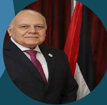
معالي الاستاذ الدكتور عمرو عزت سلامة امين عام اتحاد الجامعات العربية