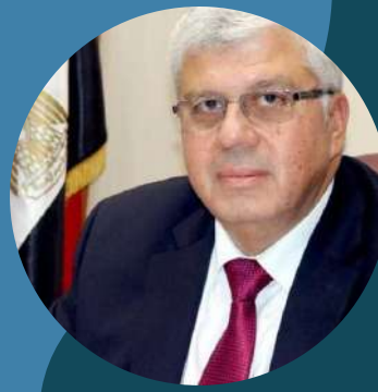
معالي الاستاذ الدكتور محمد ايمن عاشور وزير التعليم العالي والبحث العلمي

تحت رعاية معالي الاستاذ الدكتور محمد ايمن عاشور وزير التعليم العالي والبحث العلمي في جمهورية مصر العربية وبالتعاون مع اتحاد الجامعات العربية، تقيم المنظمة العربية للمسؤولين عن القبول والتسجيل في الجامعات بالدول العربية مؤتمرها التاسع والثلاثين (39)